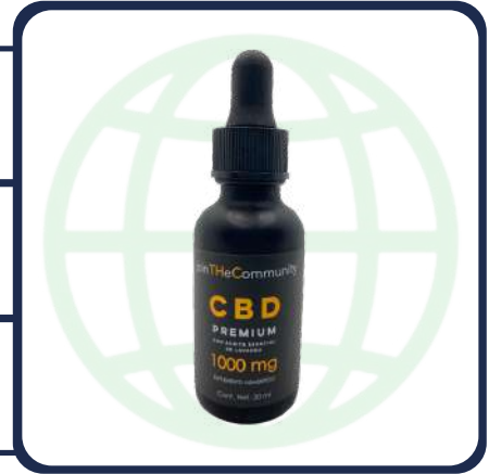
FRASCO CON 30 ML

Análisis Solicitados: Medición de cannabinoides (MCR001) Método Interno Basado en "DAB 2018 Cannabisblüten" (U-HPLC)