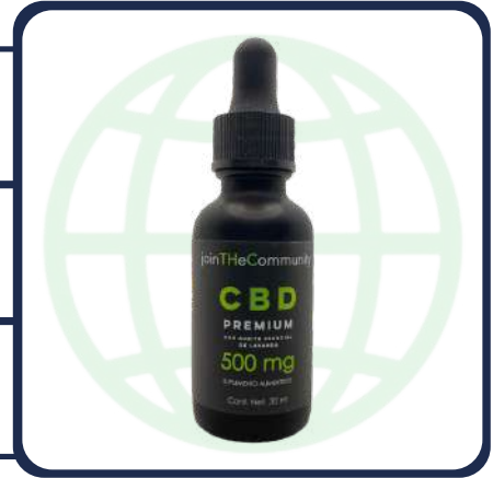
FRASCO CON 30 ML

Análisis Solicitados: Medición de cannabinoides (MCR001) Método Interno Basado en "DAB 2018 Cannabisblüten" (U-HPLC)